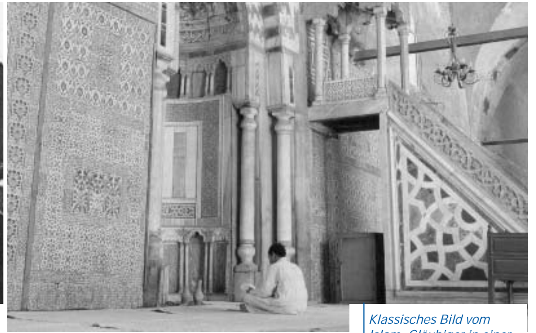
Klassisches Bild vom Islam: Gläubiger in einer Moschee