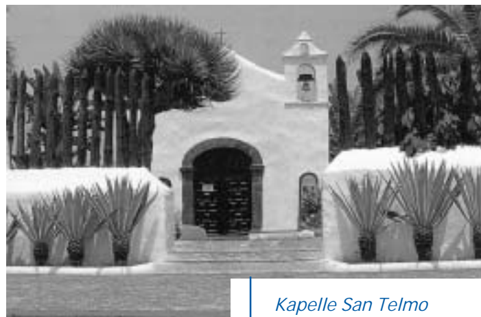
Kapelle San Telmo

Ob ich einen Traum lebe, weiß ich nicht. Schließlich sind die Menschen, die ich hier treffe, sehr real. So real wie das, was sie an Sorgen und Problemen, an Fragen und Anfragen, an Glaube oder auch Zweifel mit sich herumschleppen und im Urlaub nicht einfach ablegen können. Ich weiß, dass viele Kolleginnen und Kollegen oft etwas neidisch darauf blicken, dass ich hier an einem wunderschönen Ort dieser Erde Seelsorger sein darf. Deshalb sprechen Dritte ganz gerne von einem „Traumjob“. Nur: Ich habe Seelsorge nie als Job verstanden, sondern als Dasein für andere: Hilfestellung zum Leben und Zurechtkommen mit dem Leben, weil es einen Gott gibt, der jede und jeden von uns so unendlich liebt, dass er möchte, dass jede und jeder von uns mit seiner Frohen Botschaft dieses Leben in Fülle leben und erleben kann. Dass ich das tun darf, das ist für mich wirklich „Traumjob pur“!