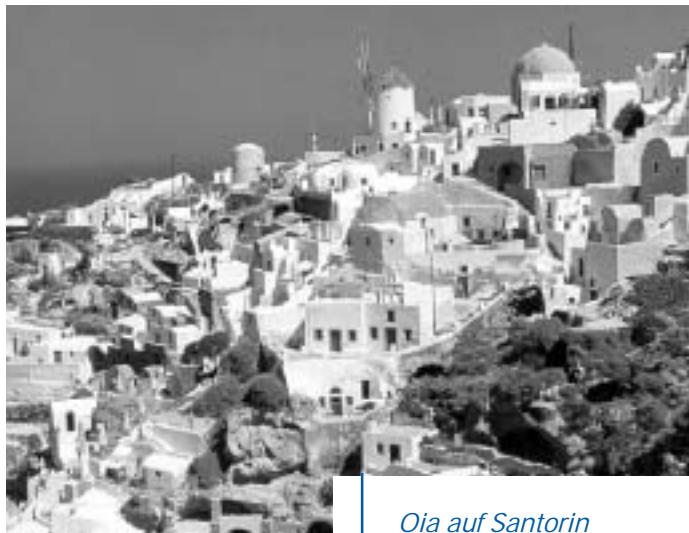
Oia auf Santorin

Zur Perle der Ägäis“, nach Santorin führt eine Ferienakademie vom 13. bis 20. Oktober 2003. Geruh- same Erkundungen kreisen um den Vulkanismus, der die Insel prägt, wie auch um die Schönheiten Santo- rins: die dunklen Steilhängen, die weißen Häuser, das tiefblaue Wasser der Ägäis und vor allem das unverwech- selbaren Licht der Sonnenuntergänge. Nicht zu kurz kommen wird auch die Beschäftigung mit den archäo- logischen Funden auf der südlichsten der Kykladenin- seln. Der Archäologe und Philologe Stamatis Lympero- poulos leitet die Ferienakademie. (bre)