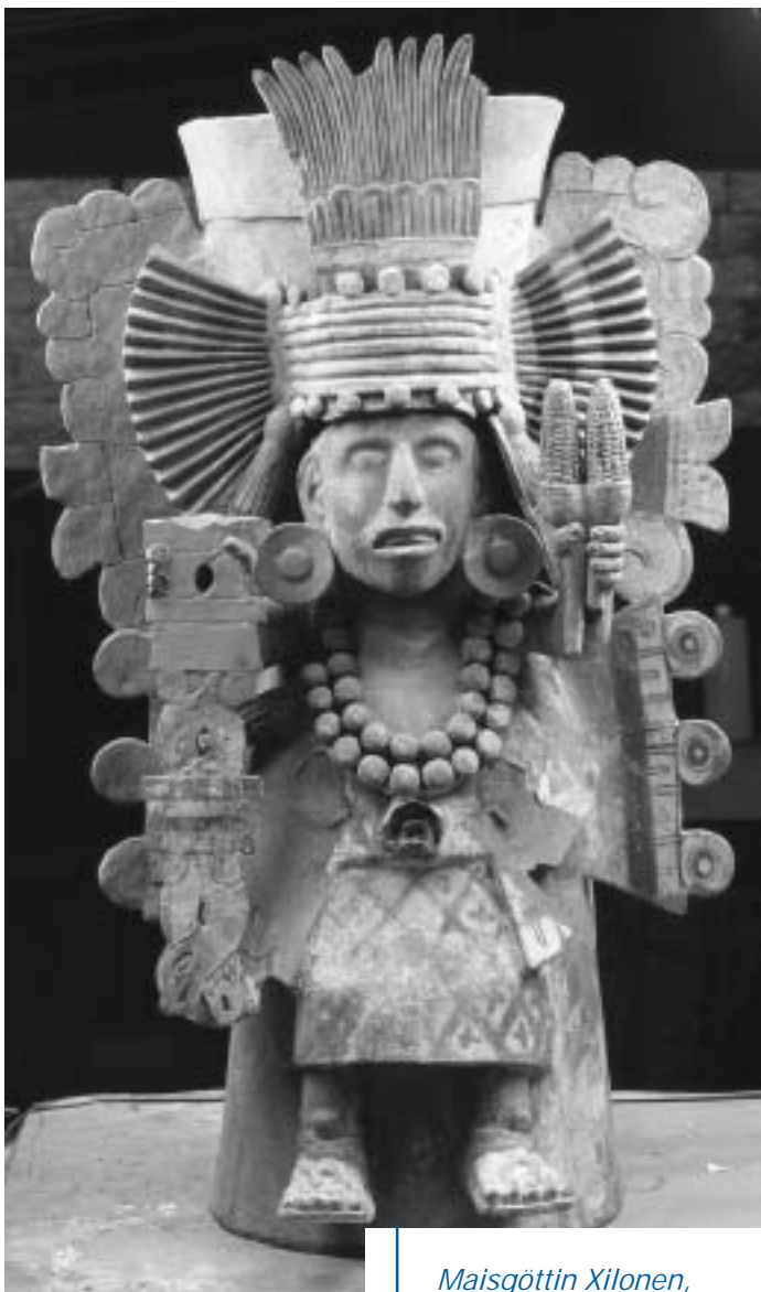
Maisgöttin Xilonen, aztekisch, um 1500

Cortés und die Seinen mussten nach einer Niederlage im Kampf um die Hauptstadt der Azteken selbst aus der Ferne miterleben, wie gefangene Spanier dem aztekischen Kriegsgott Huitzilopochtli geopfert wurden – eine Szene, die sich so in das kollektive Bewusstsein