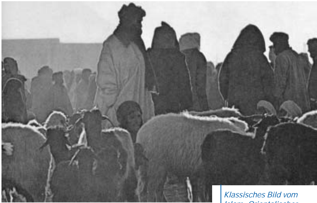
Klassisches Bild vom Islam: Orientalischer Markt mit Tieren