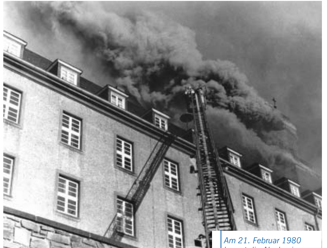
Am 21. Februar 1980 brennt die Akademie