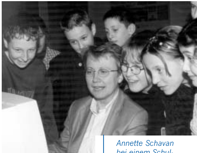
Annette Schavan bei einem Schulbesuch

Das System Schule ist ungemein komplex. Deshalb müssen Maßnahmen immer aufeinander abgestimmt werden und ineinander greifen: Die Reformen in Baden-Württemberg bilden beispielsweise von der früheren Einschulung über das Fremdsprachenlernen in der Grundschule, den neuen Bildungsplänen in allen Schularten, neuen Fächerverbänden, der neuen Oberstufe und der kürzeren Gymnasialzeit eine sinnvolle Einheit, die durch Maßnahmen in der Lehrerbildung und -fortbildung, durch die Stärkung der Schulleitungen ebenso wie durch organisatorische Maßnahmen in der Schulverwaltung ergänzt werden.