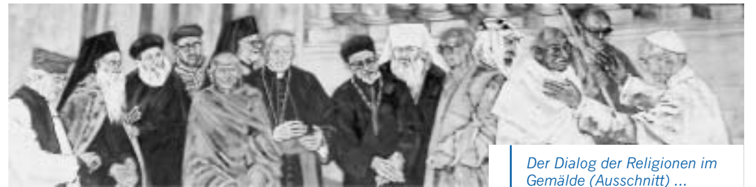
Der Dialog der Religionen im Gemälde (Ausschnitt) ...