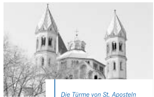
Die Türme von St. Aposteln