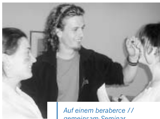
Auf einem beraberce // gemeinsam -Seminar