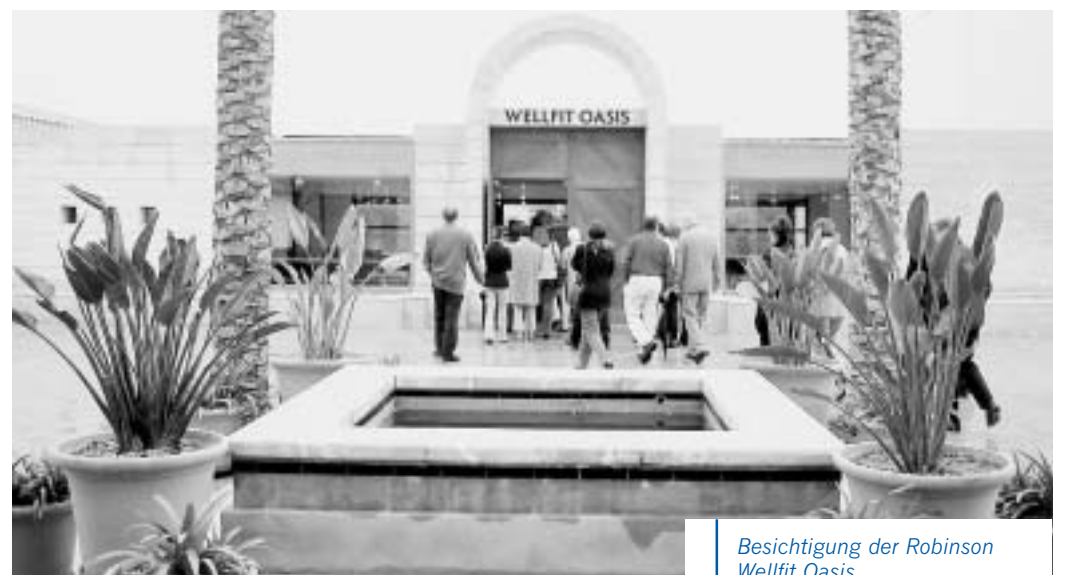
Besichtigung der Robinson Wellfit Oasis

Das März-Wetter ist sonnig und klar, aber ein wenig kühl. Rund 40 Experten – Architekten, Betreiber von Wellness-Anlagen, Designer, Banker, Consultants, Touristiker und Investoren – sitzen in einem Tagungsraum des neu eröffneten Robinson Club Cala Serena. Sie sind mit der Akademie hierhin gereist, um über den Megatrend Gesundheit und Wellness zu diskutieren. Zwei Tage hatten sie schon engagiert debattiert, über Trends, Architekturkonzepte und Erfolgsfaktoren. Viel gesehen hatten sie auch schon: Die viel gepriesene Wellness-Oase des Clubs, drei weitere Wellness-Anlagen mallorquinischer Luxushotels und ein im Zen-Stil gestyltes Hotel – ein ehemaliges Kloster mitten in Palma.