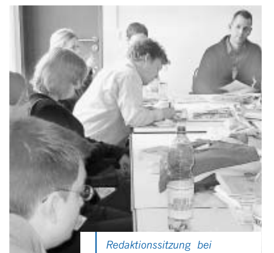
Redaktionssitzung bei „young press“

Zum Glück gab es ja auch noch die professionelle Betreuung. Täglich stand ein Reisejournalist zur Verfügung, der sich um die kleinen und großen Probleme des Nachwuchses kümmerte. „Wie kann ich das ausdrücken?“, „Wer kann was dazu sagen?“, „Wie sollte man an das Thema herangehen?“ – auf nahezu jede Frage gab es eine Antwort von der Fachfrau oder dem Fachmann. Am Ende eines jeden ereignisreichen Arbeitstages in den Berliner Messehallen war das Etappenziel erreicht – der rund 15 Seiten starke „ITB young press“-Pressedienst war fertig. Nach dem anstrengenden, aber unglaublich vielseitigen Journalistenalltag gab es auch eine Belohnung: Ab 18 Uhr wurde so manches erfrischende Kaltgetränk während der königsblauen Stunde im Pressezentrum eingenommen. Und wenn man schon mal in Berlin ist, dann darf natürlich auch das Nachtleben in der Hauptstadt nicht vernachlässigt werden. Die harte, lehrreiche und interessante Arbeit am Tag und das Entdecken des nächtlichen Berlins machten den Presseworkshop auf der Internationalen Tourismus-Börse zu einem ganz besonderen Erlebnis. Kontakte wurden geknüpft, Freundschaften geschlossen – und so mancher Teilnehmer weiß jetzt, was sein Traumberuf ist.