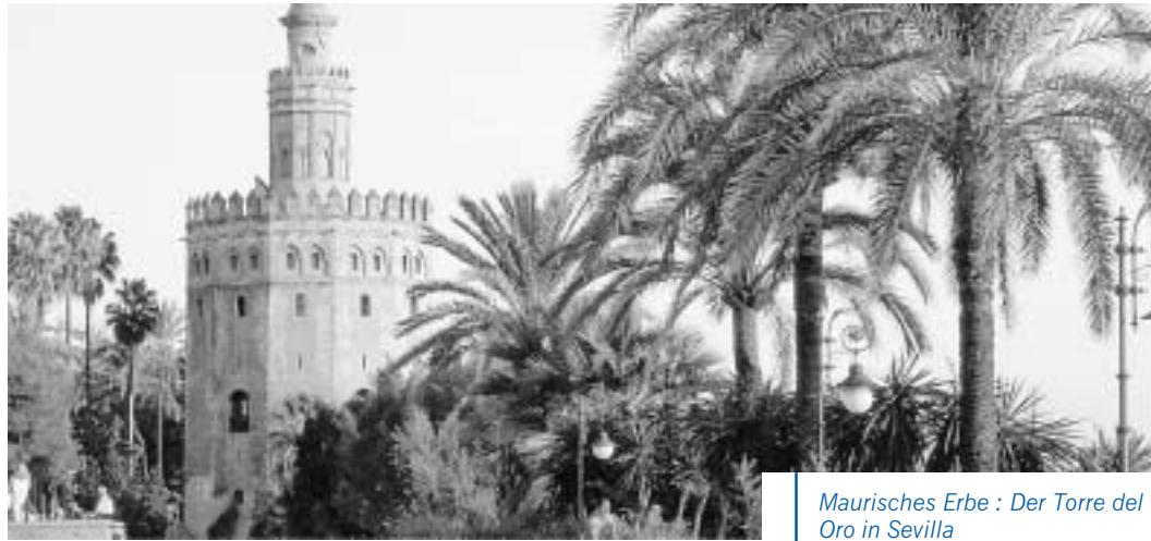
Maurisches Erbe : Der Torre del Oro in Sevilla

Die Zahl der in Spanien lebenden Menschen muslimischen Glaubens ist in den letzten 25