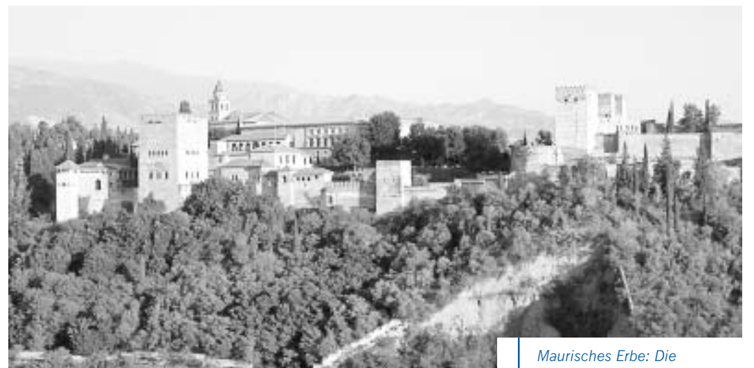
Maurisches Erbe: Die Alhambra in Granada

Spanien hat wenig getan, um seine Sprache und Kultur in Nordmarokko zu fördern und zu verbreiten. Die früher so liberale und internationale Stadt Tanger ist zu einem Zentrum des Fundamentalismus mit zahlreichen gewalttätigen Gruppen Jugendlicher geworden. Tanger liegt nur 15 Kilometer von der spanischen Küste entfernt.