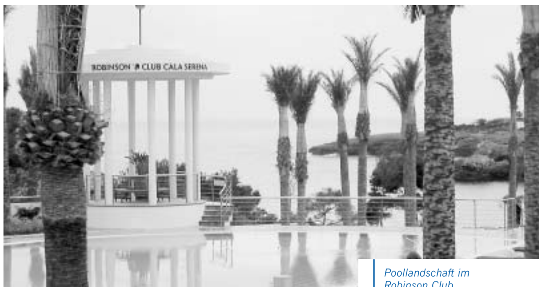
Poollandschaft im Robinson Club