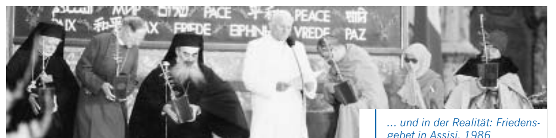
... und in der Realität: Friedensgebet in Assisi, 1986

Vielleicht gelingt es so, Bilder neu zu entziffern und zu interpretieren – solche in Öl und solche in den Köpfen. (bre)